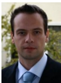
Remigijus Rekerta Komisijos pirmininkas

Paskirtas 2010-05-20, Lietuvos Respublikos Seimo Pirmininko teikimu